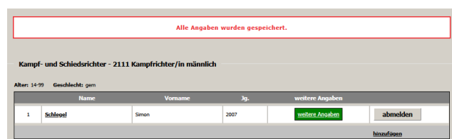
Weitere Angaben erledigt