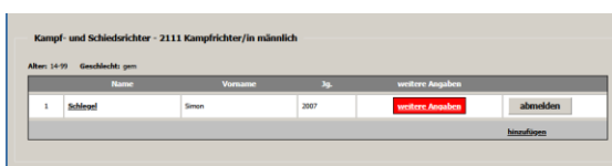
Weitere Angaben fehlen

Wenn alles funktioniert hat, erscheinen die gemeldeten Kampfrichter in einer neuen Spalte mit einem roten Feld: „weitere Angaben“. Klicken Sie dieses an und hinterlegen Sie die benötigten Informationen (Kampfrichtlizenzen, E-Mail Adresse, Durchgang, ...). Wenn dies erledigt ist wird das Feld grün.